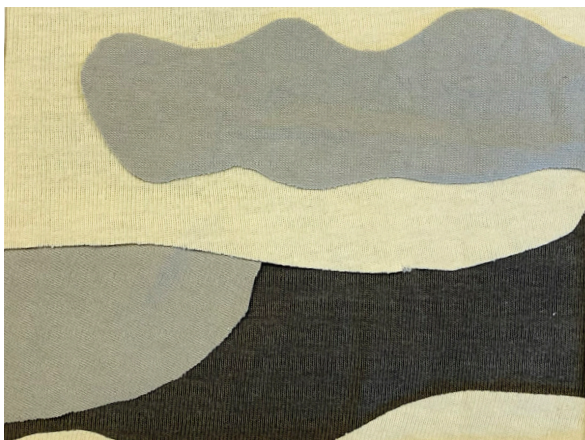
Eksempler på hvordan der kan arbejdes med placering af mønsterdele.